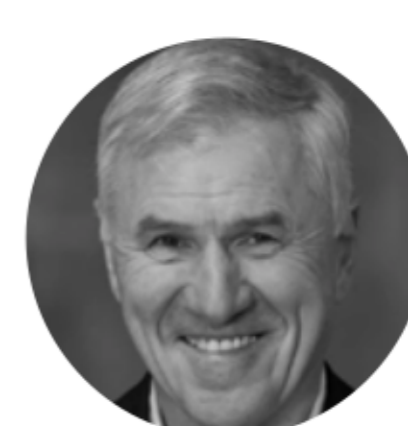
Walter Posch Gastautor bei Libratus

Ganz und gar freiwillig kehrten dafür die Briten Europa mit dem Brexit den Rücken, die sich von der Hinwendung zur transatlantischen Verwandtschaft grösseren Nutzen erwarteten. Inzwischen ist die Zuneigung zum grossen Bruder aufgrund unterschiedlicher Interpretationen von „Meinungsfreiheit“ etwas abgekühlt, einer der drei willigen Möchtegerne, der britische Premier, musste zuletzt doch starke Rüffel von Onkel Donald einstecken, wengleich er vor den Kameras tränenerstickt britischen Gleichmut zu signalisieren versuchte.