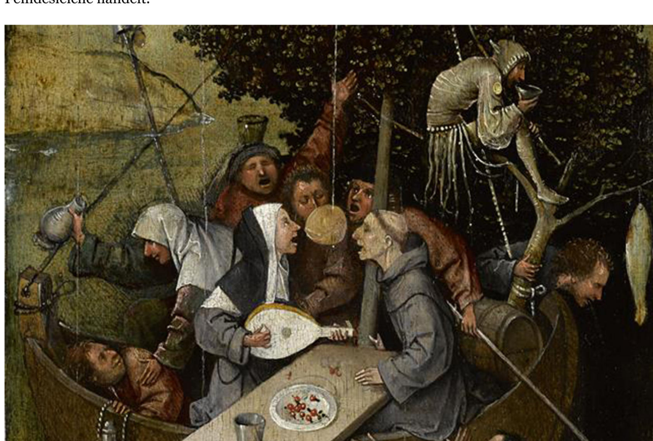
Das Narrenschiff von Hieronymus Bosch (Ausschnitt).

Der auf einem Stock aufgespießte Krug, eine sexuelle Anspielung, verweist auf Wollust, deren Freuden Frau und Mann im Bug des Schiffes sich begeben, während im tiefsten Schatten des Bootes eine Wasserleiche treibt, die keiner der Narren bemerkt und die mangels DNA-Analyse anonym bleiben muss. Selbst Forensiker konnten nicht feststellen, ob es sich dabei um eine deutsche, ukrainische, russische oder eine den Kriterien der EU-Bürokratie gemäße Freundes- oder Feindesleiche handelt.