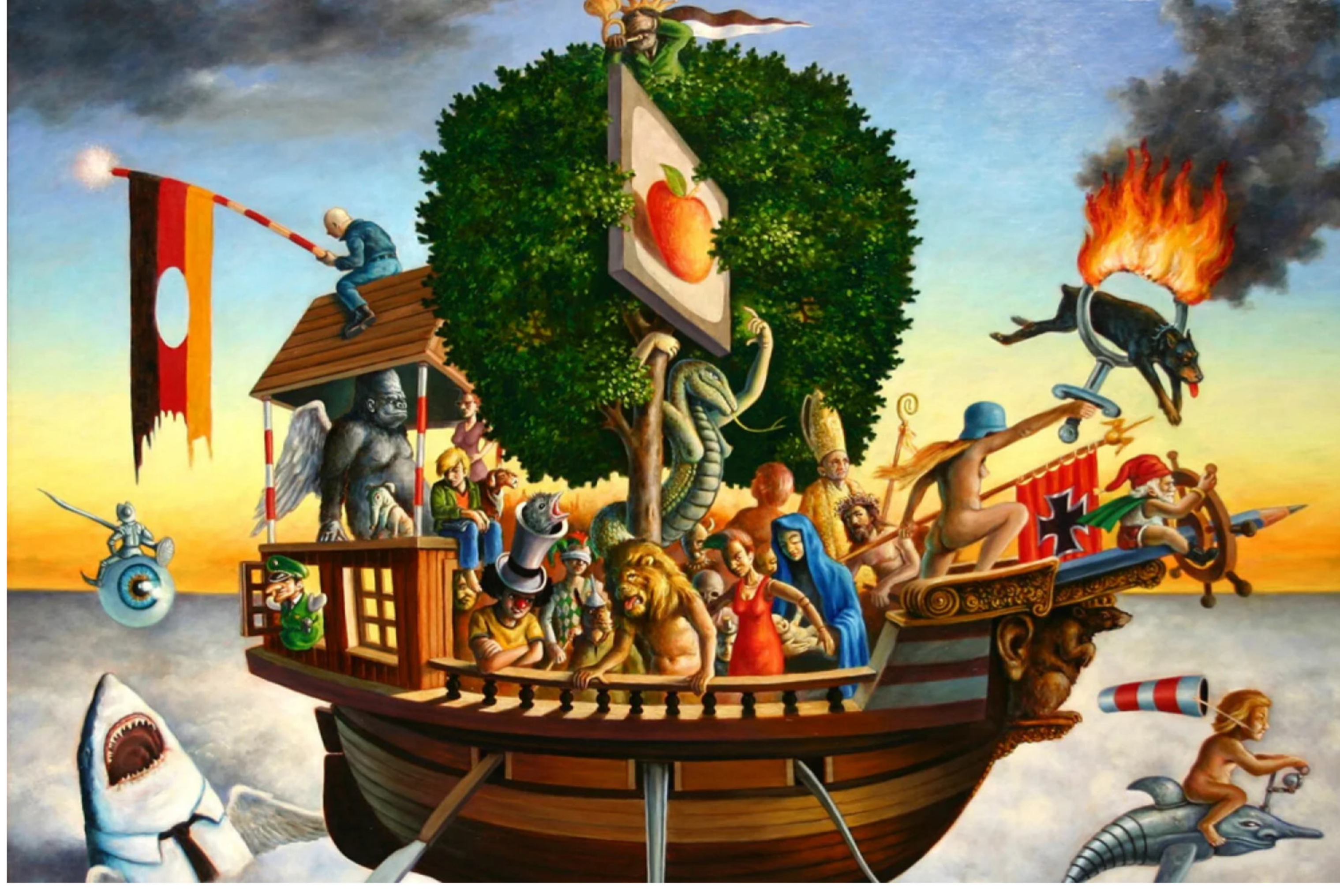
"Narrenschiff" von Thomas Bühler (2009).